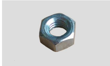
Artikel Nr. 10.30100.0001 Sechskantmutter M5