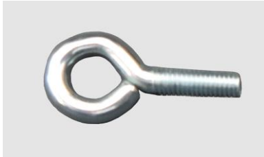
Artikel Nr. 10.30005.0003 Ringschraube M5 20 mm

Für die Montage der Babyschale wird eine Ringschraube M4 benötigt, diese wird mit der Babyschale mitgeliefert. Sollten Sie bereits eine alte Babyschale haben, können Sie diese Schraube bei uns bestellen ( info@leggero.ch ).