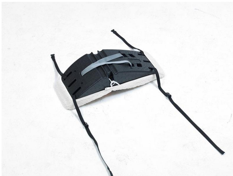
Babyschale von hinten (mit Abdeckung)

Vor der Montage der Babyschale nehmen Sie zwei der mitgelieferten Bänder und befestigen diese an der Babyschale, wie in den nachfolgenden Abbildungen gezeigt.