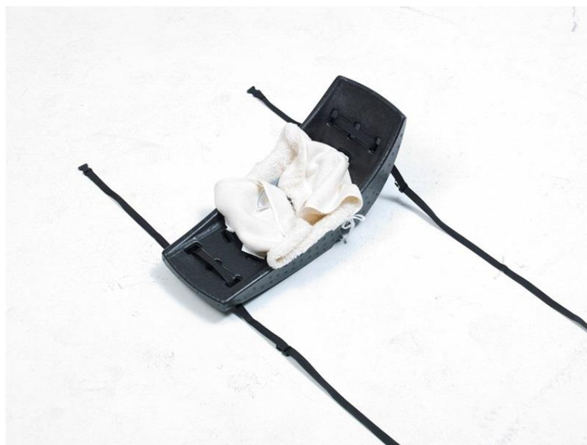
Babyschale von vorne (ohne Abdeckung)