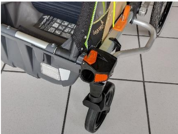
9. Prüfen, ob alle Komponenten sicher verschraubt sind und eine Funktionskontrolle durchführen.