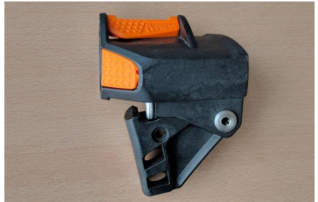
8. Neue Stollereinheit nehmen und in umgekehrter Reihenfolge alle Komponenten wieder montieren.